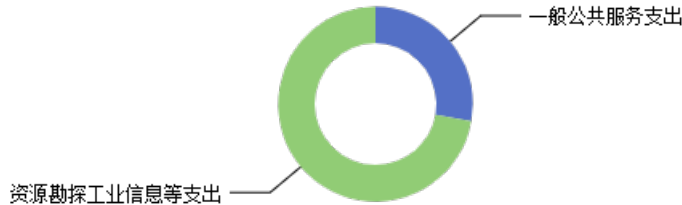
一般公共预算当年拨款结构图

2023年度一般公共预算当年拨款373.91万元，主要用于以下方面：一般公共服务支出103.91万元，占27.79%；资源勘探工业信息等支出270.00万元，占72.21%。